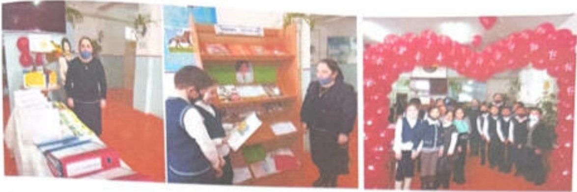
Оқушылар қойылған көрмемен танысу кезеңі

Қазақтың жақсы қасиеттерінің асылы - жомарттық, кенпейілдік, мейірімділікті оқушы бойына ұялату мақсатында сыныптар арасында түрлі іс-шаралар өткізілді. Жомарт болу - өзінде барды әр адаммен шын жүректен бөлісу. «Жылуы жоқ үйден без, қайырымы жоқ биден без», - дегендей қайырымдылық, адамгершілікті биік ұстап, кісілікті ту етіп, көкірегі қаюулы, жаны жаралы жанның жасын сүртіп, жылы лебізін аямай, қолдан келген жәрдемін ұсынып, достық пейілдерін танытуға үлес қоса білуге атсалысқан «Қолғабыс» тобының сынып аралық жәрменке ұйымдастыруымен тұрмысы төмен, отбасы балаларына қаржылай және жалғыз басты қарттарға азық-түлікпен қол жәрдем берумен көмек көрсетілді. Қайырымды істер жасау арқылы балалардың ризашылығы пен алғыстарын ала отырып, үлкен - кішіге деген сүйіспеншілігін, сыпайылық қарым - қатынасын дамытуға тәрбиелеу Ы.Алтынсарин атындағы жалпы орта білім беретін орта мектебінде жалғасын таба білді.