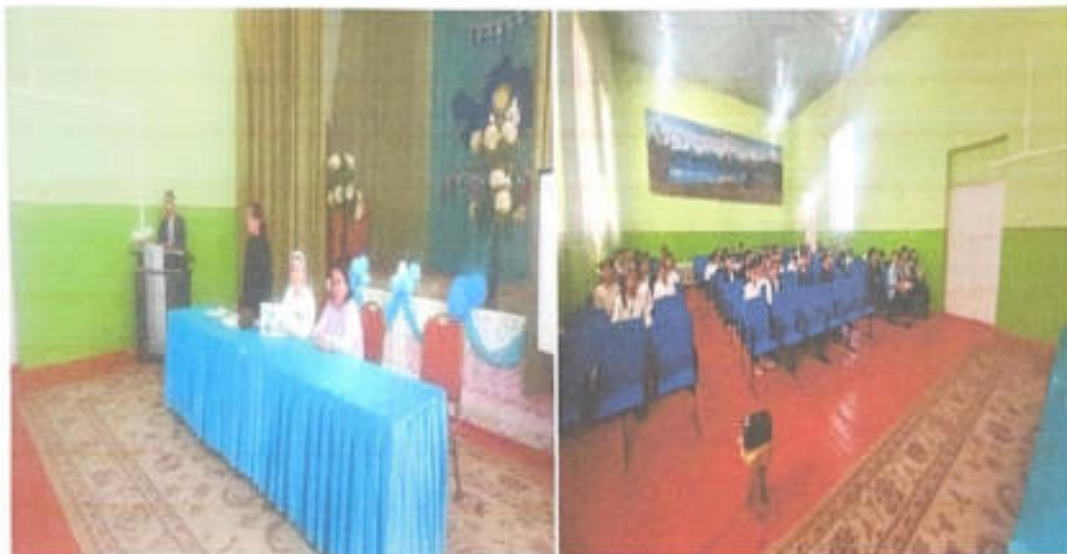
Ботулизм тамақтану алудың алдын алу кезеңінен үзінді.

2023 жыл қазан айында Созақ аудандық СЭС және емхана, мектеп мейірбикелерімен бірлесіп Мектептегі тамақтануды ұйымдастыру тақырыбы толық қанды жылжымалы тақта арқылы түсіндірілді.