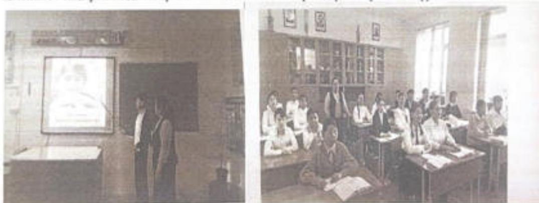
«Бала құқығы – асыл қазынам» сабақ кезеңінен.

Қазақстан Республикасының білім және ғылым министрлігі Балалардың құқықтарын қорғау, адам құқықтарын сақтау, өз құқықтары мен міндеттерін жүзеге асыруға дайындық қабілеттерін қалыптастыру негізінде 2023 жылы қараша айында «Бала құқығы – асыл қазынам» тақырыбында пікір талас сабағы өтіліп түсіндірме жұмысы жүргізілді.